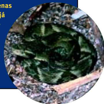
Figura 8. A jararaca-de-alcatrazes ocorre apenas na ilha dos Alcatrazes, ao largo do litoral norte de São Paulo

Tais pressões, associadas ao fato de estar restrita a uma pequena ilha, fazem com que a jararaca-ilhoa seja considerada uma espécie ameaçada de extinção. Embora sua densidade populacional seja grande, um incêndio que atingisse a ilha inteira poderia eliminar todos os indivíduos. Com base nesses argumentos, os autores recomendaram à União Mundial para a Conservação da Natureza (IUCN) a inclusão da B. insularis na categoria 'criticamente ameaçada' na edição de 2000 da Lista Vermelha de Espécies Ameaçadas ( www.redlist.org ). A jararaca-ilhoa também faz parte das listas oficiais de espécies da fauna ameaçada de extinção do estado de São Paulo e do Brasil.