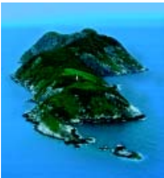
Figura 1. O hábitat da jararaca-ilhoa é a ilha da Queimada Grande, ao largo do litoral sul de São Paulo

A jararaca-ilhoa foi descrita em 1921 pelo herpetólogo Afrânio do Amaral (1894-1982), do Instituto Butantan. Em 1959, o zoólogo belga Alphonse R. Hoge (1912-1982) e colaboradores, também do Butantan, relataram a presença em várias fêmeas do órgão copulador do macho (hemipênis), com tamanho reduzido, e as chamaram de intersexos. Sabe-se agora que são fêmeas verdadeiras e o órgão é denominado