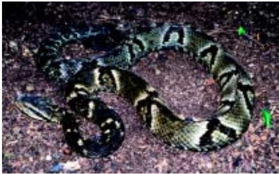
Figura 6. A jararaca comum do continente ( Bothrops jararaca ) é diferente, na coloração, de sua 'parente' insular (na fase juvenil, tem a ponta da cauda clara)

densidade da espécie na ilha é tão grande que em apenas um dia é possível encontrar até 60 dessas serpentes. No continente, em contraste, estudos realizados na mata atlântica nos últimos 15 anos encontraram no máximo três jararacas comuns por dia. A superpopulação de jararacas-ilhoas na ilha da Queimada Grande pode decorrer da quase ausência de predadores de serpentes e da grande disponibilidade de alimento.