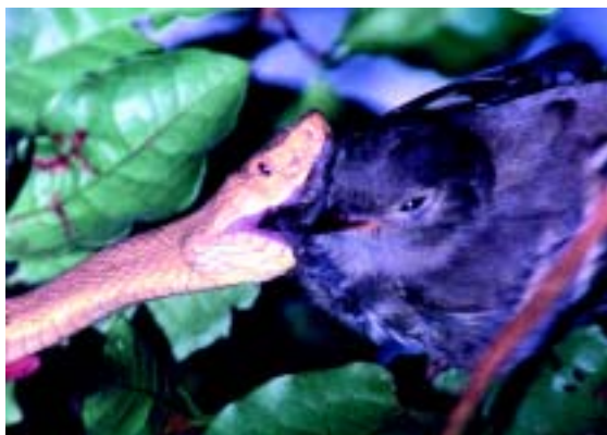
Figura 9. A jararaca-ilhoa ingerindo um dos pássaros de sua dieta, o tuque ( Elaenia mesoleuca )

Embora a maior parte da ilha da Queimada Grande esteja preservada, existem áreas desmatadas no passado, hoje cobertas por capim. Ao longo dos últimos sete anos, tais áreas voltaram a ser invadidas pela mata, mas sua recuperação total deve demorar muitos anos. Além dessa ameaça, aparentemente controlada, há evidências de capturas ilegais de jararacas-ilhoas, provavelmente para o mercado negro de animais silvestres.