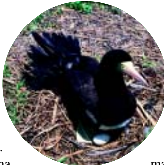
Figura 2. O atobá Sula leucogaster – com ovos, em seu ninho – é a ave marinha mais abundante na ilha

Várias aves marinhas freqüentam a ilha: a fragata ( Fregata magnificens ), o gaivotão ( Larus dominicanus ), o trinta-réis (gênero Sterna ) e, principalmente, o atobá ( Sula leucogaster ), que faz ninhos ali (figura 2). Além das aves marinhas, cerca de 30 espécies de pássaros, a maioria migratórias, são avistadas na ilha em certas épocas do ano. Também há pássaros residentes, como a corruíra ( Troglodytes aedon ) e a cambacica ( Coereba flaveola ).