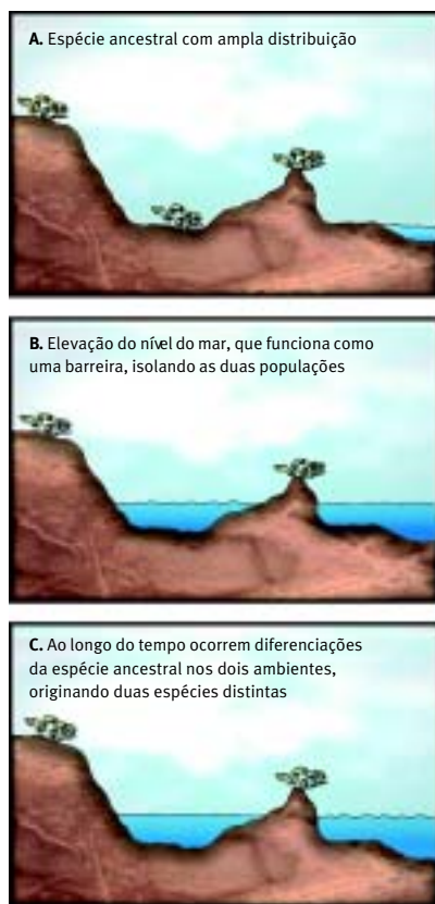
Figura 7. Modelo de especiação alopátrica, decorrente do isolamento de uma ilha em função da elevação do nível do mar

A jararaca-ilhoa parece acasalar-se entre março e julho (figura 10), e os filhotes nascem nos primeiros meses do ano. A taxa de natalidade parece ser baixa, pois uma ninhada de jararaca-ilhoa raramente ultrapassa 10 filhotes, enquanto a da jararaca comum pode chegar a 30. Além disso, poucas fêmeas prenhes foram registradas durante os estudos na ilha.