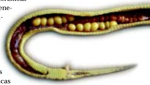
Figura 5. Fêmea de jararaca-ilhoa dissecada, mostrando os folículos ovarianos e o órgão denominado hemiclitéris

A ilha da Queimada Grande apresenta uma das maiores densidades populacionais de serpentes conhecidas no mundo. Não há estimativas precisas da população total de jararacas-ilhoas, mas alguns cálculos indicam um número entre 2 mil e 4 mil. A ▶