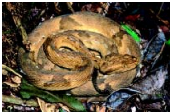
Figura 4. Embora permaneça mais tempo sobre a vegetação, a jararaca-ilhoa ( Bothrops insularis ) às vezes é encontrada no chão da mata

Um modelo para explicar a diferenciação entre a jararaca-ilhoa e a do continente é a especiação alopátrica. Segundo esse modelo, duas populações separadas por alguma barreira geográfica podem sofrer diferenciação ao longo do tempo, tornando-se espécies distintas. Um cenário desse tipo pode ter dado origem à jararaca-ilhoa. O nível do mar sofreu oscilações no período Quaternário, criando em vários momentos passagens secas entre a ilha e o continente. Possivelmente, em um desses momentos havia apenas uma espécie ancestral de jararaca. Com a elevação do nível do mar, uma população teria fica-