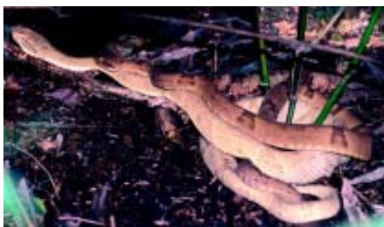
Figura 10. Dois indivíduos de jararaca-ilhoa durante o ritual de cortejar, que precede o acasalamento